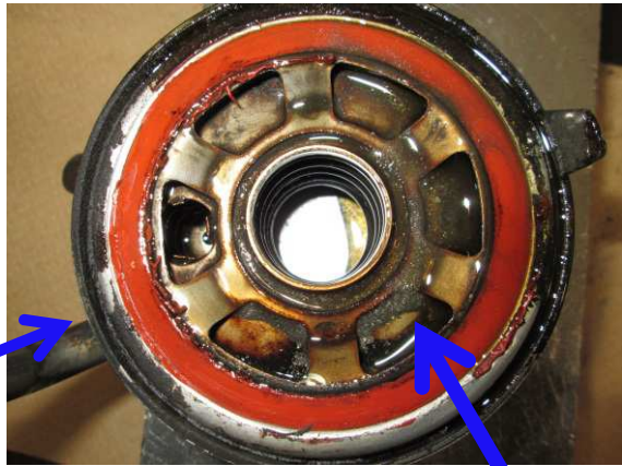
オイルクーラー スラッジの堆積