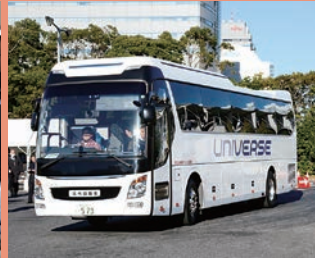
最新バス試乗 (運転体験は予約制)